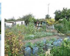
Les jardins partagés

Projet des Tartres : dynamique sociale et projet de gestion Agences DAC/ Adage pour Plaine Commune Janvier 2014