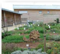
La ferme de Rosny