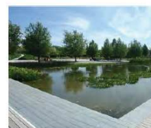
La gestion de l'eau